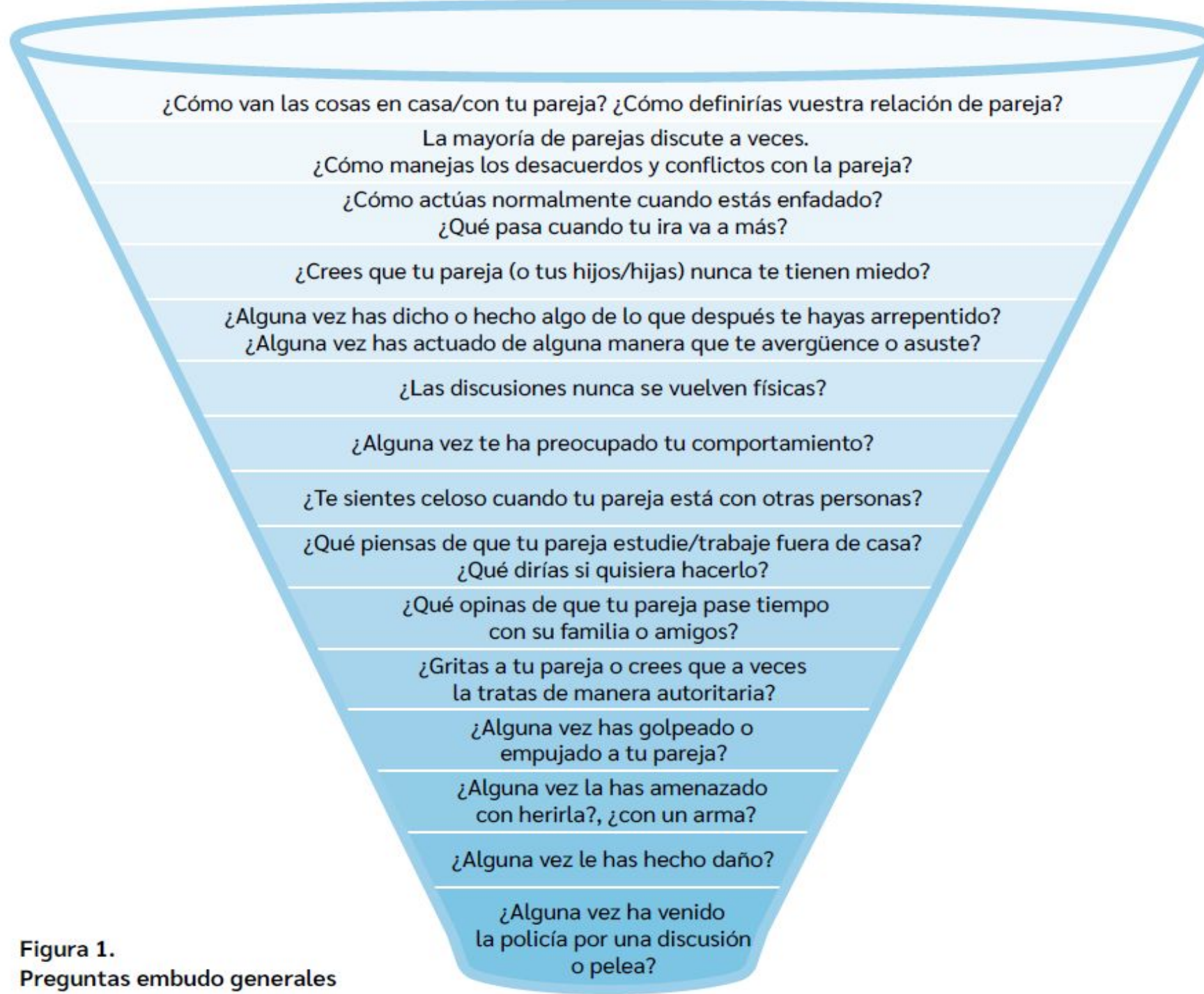
Figura 1. Preguntas embudo generales