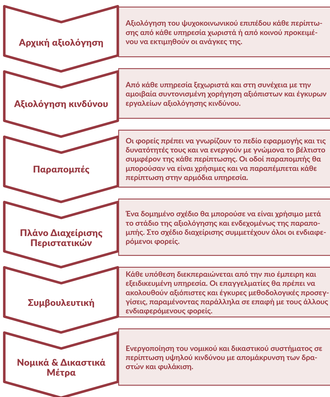
Σχήμα 10: Διαδικασία συντονισμένης απόκρισης του Μοντέλου Πολύ-υπηρεσιακής Συνεργασίας MOVE

Σε όλες τις ακόλουθες διαδικασίες είναι χρήσιμο να λαμβάνεται υπόψη η εντολή προστασίας. Στόχος της είναι η απομάκρυνση του δράστη, με νομικά μέσα, αν είναι απαραίτητο και δυνατό, και η λήψη κάθε δυνατού μέτρου για να διασφαλιστεί ότι ενεργοποιούνται όλοι οι πόροι για την αποκατάσταση και τη μακροπρόθεσμη ασφάλεια του θύματος. Προτεραιότητα θα πρέπει να δοθεί στη διασφάλιση της διατήρησης της φυσικής και ψυχολογικής απόστασης μεταξύ του δράστη και του θύματος, καθώς αποτελεί προϋπόθεση για την αρχική αποκατάσταση του θύματος και την ικανότητά του να λαμβάνει τεκμηριωμένες αποφάσεις.