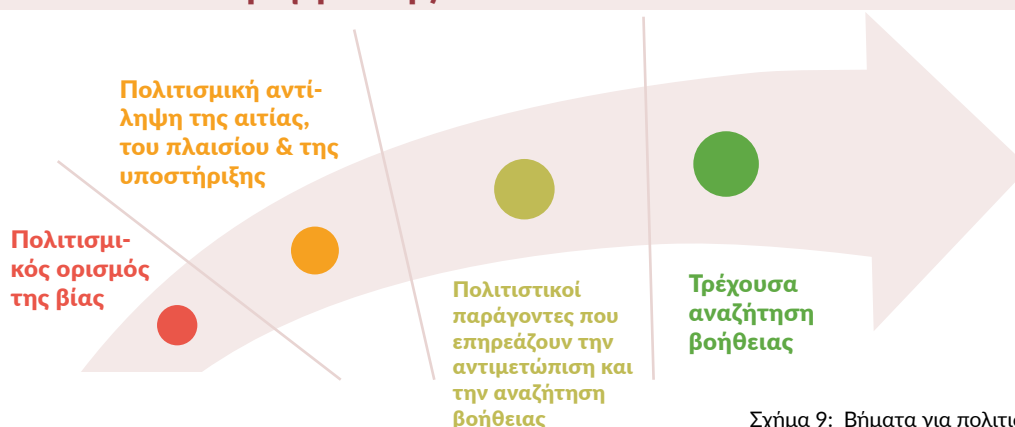
Σχήμα 9: Βήματα για πολιτισμική επάρκεια (APA 2013)