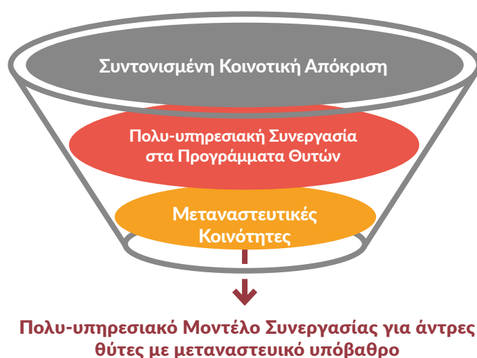
Σχήμα 2: Πηγές του Μοντέλου Πολυ-υπηρεσιακής Συνεργασίας MOVE

Το Μοντέλο Πολυ-υπηρεσιακής Συνεργασίας MOVE προσαρμόζει τα αποτελέσματα αυτών των δύο μοντέλων προκειμένου να ικανοποιήσει τις ειδικές απαιτήσεις που προκύπτουν κατά τη διαχείριση των ανδρών θυτών βίας κατά των γυναικών και των κοριτσιών με μεταναστευτικό υπόβαθρο.