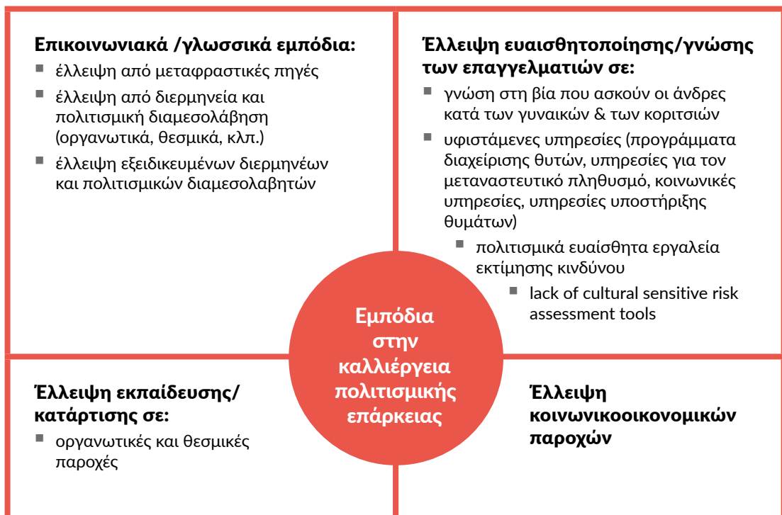
Σχήμα 1: Εμπόδια σε σχέση με την καλλιέργεια πολιτισμικής επάρκειας