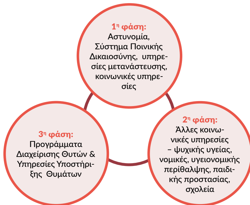
Σχήμα 7. Τρεις φάσεις παρέμβασης στο πλαίσιο του μοντέλου Πολύ-υπηρεσιακής Συνεργασίας MOVE

→ Τρίτη φάση: Εμπλέκονται υπηρεσίες που παρέχουν πιο εστιασμένες και εξειδικευμένες ψυχοκοινωνικές παρεμβάσεις στους θύτες. Τα Προγράμματα Διαχείρισης Θυτών και οι Υπηρεσίες Υποστήριξης των Θυμάτων περιλαμβάνονται σε αυτή την κατηγορία. Αυτές παρέχουν ψυχολογική υποστήριξη, συμβουλευτική και θεραπεία έπειτα από την ανάπτυξη ενός σχεδίου διαχείρισης των υποθέσεων σε συνεργασία με όλες τις εμπλεκόμενες υπηρεσίες. Λαμβάνοντας υπόψη ότι οι υπηρεσίες αυτής της φάσης μπορούν να συνεργαστούν με τις υπηρεσίες της δεύτερης φάσης, είναι δυνατόν να γίνει παραπομπή άμεσα από τη φάση 1 στη φάση 3.